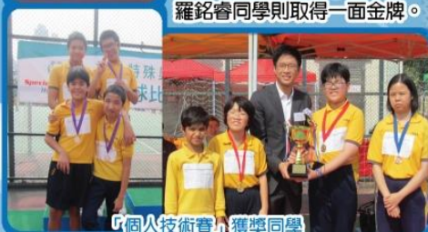
「個人技術賽」獲獎同學