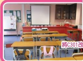
將C301改建為標準課室