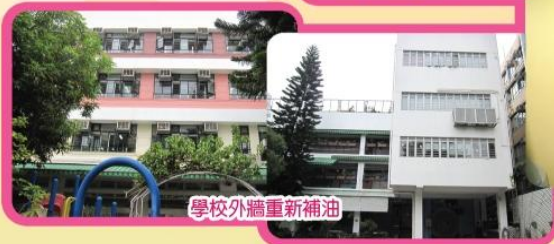
學校外牆重新補油