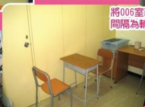
將006室部分空間間隔為輔導室