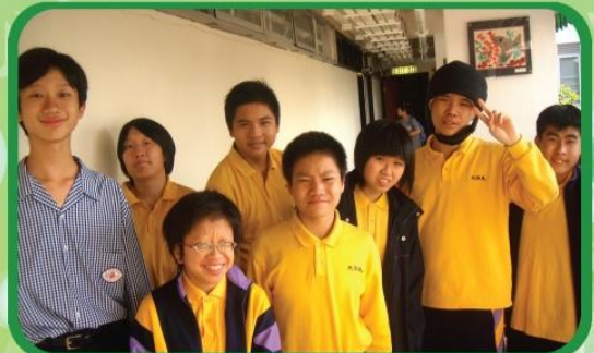
公益少年團新任委員合照