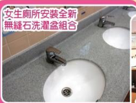
女生廁所安裝全新無縫石洗滌盆組合