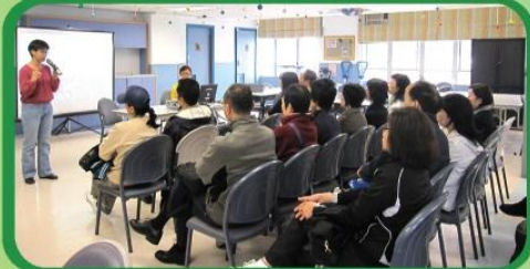
畢業生家長座談小組