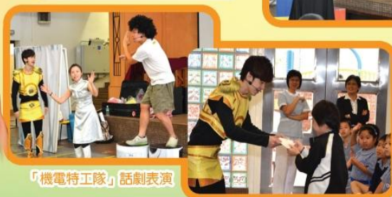
「機電特工隊」話劇表演