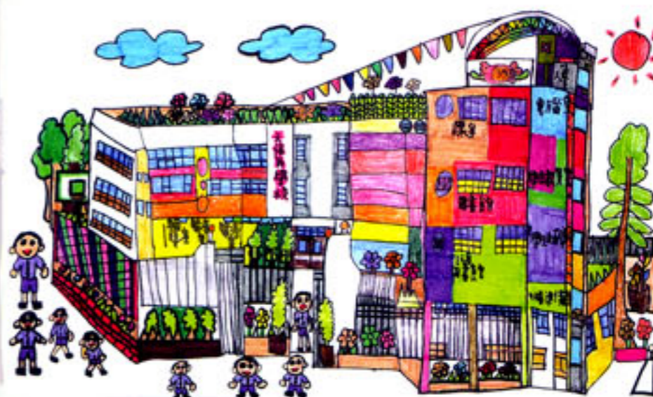
三十五周年校慶填色比賽 中學B班冠軍 鄧潤林